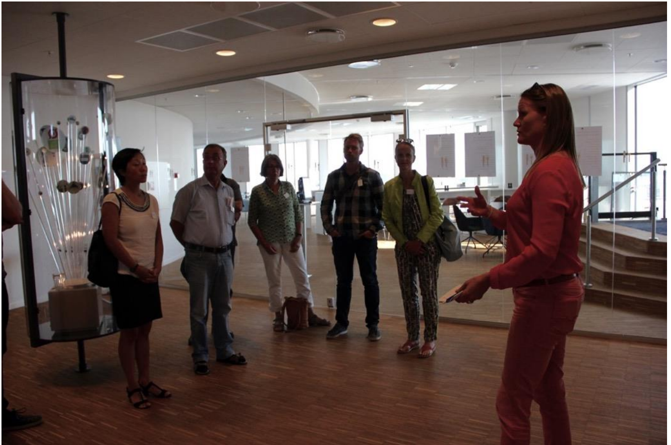
Vi får en rundvisning i huset, hvor vi ser fire af de ti audiovisuelle og interaktive installationer der er i Experimentarium for standarder.