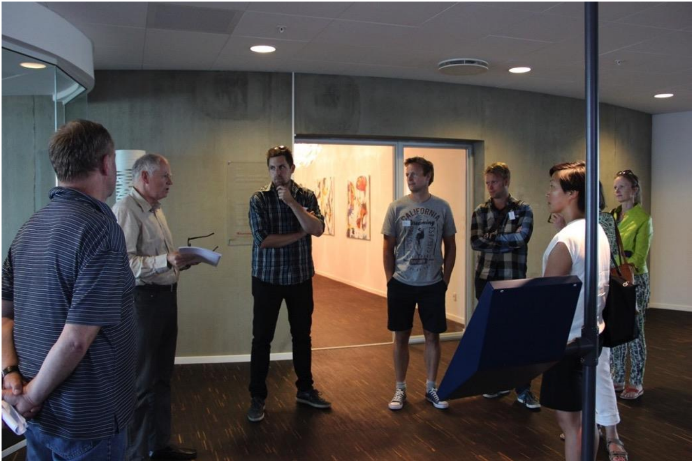
På 9. etage hører vi om standarder for ledelsessystemer, som er opbygget omkring 'Plan-Do-Check-Act' modellen.