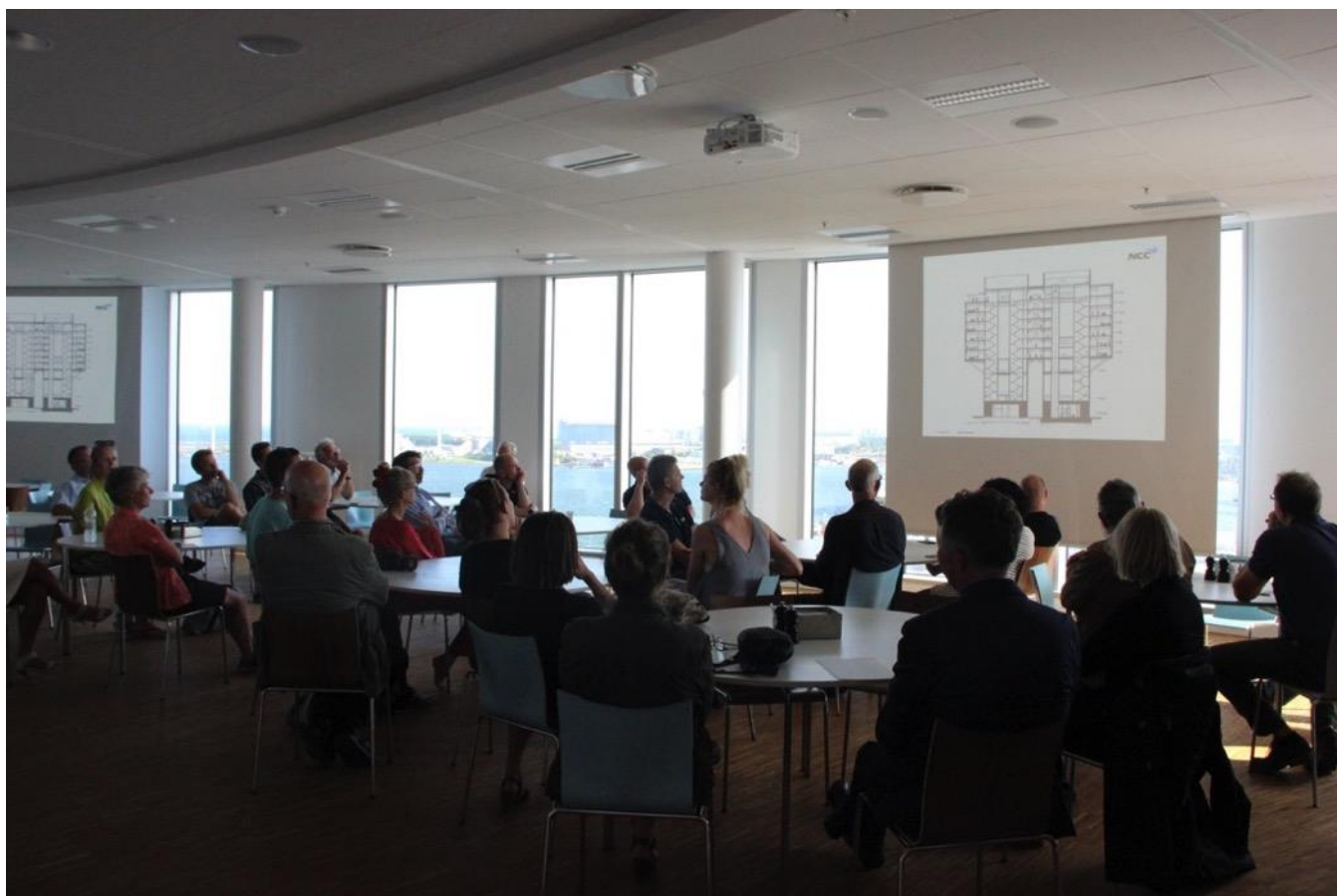
Siloerne blev oprindeligt etableret i 1979 og blev brugt til at opbevare cement. Siloerne er nu omdannet til et 7 etagers kontorbyggeri, som svæver 24-59 meter over terræn.