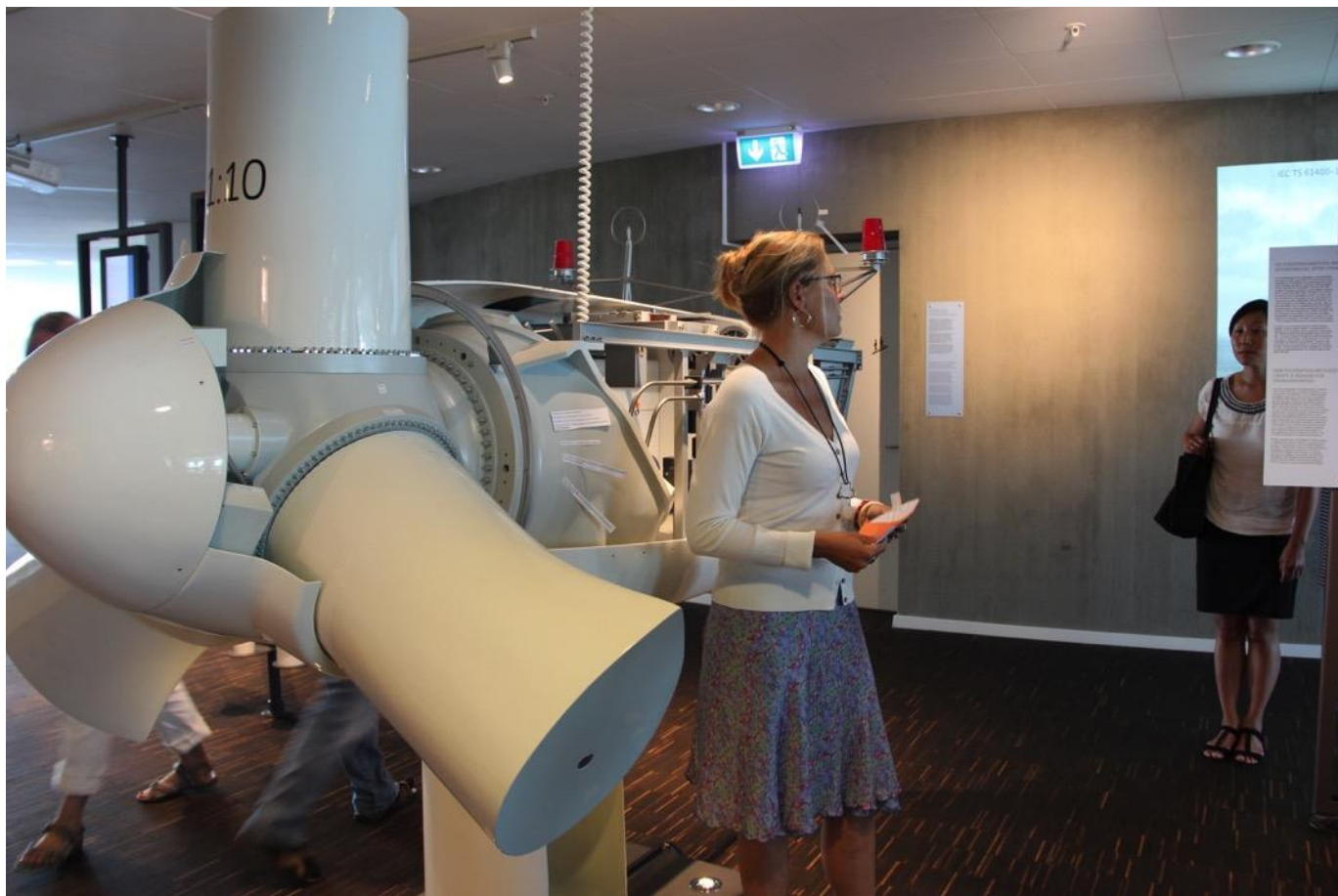
På 10. etage hører vi om standarder for vindmøller bl.a. for design og tests af vindmøllers ydeevne.