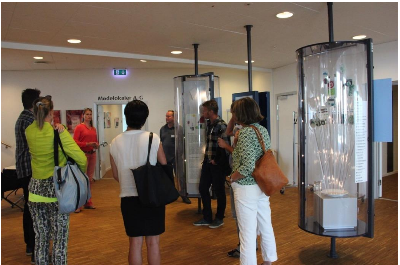
På 12. etage hører vi om svanemærket og kriterierne for at en kantine kan blive svanemærket, som kantine i Portland Towers er.