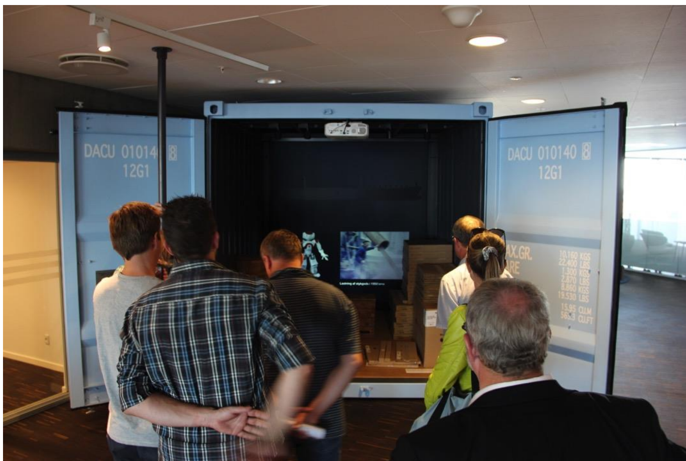
På 11. etage hører vi om standarder for containere og ser en video om skibscontainerens historie.