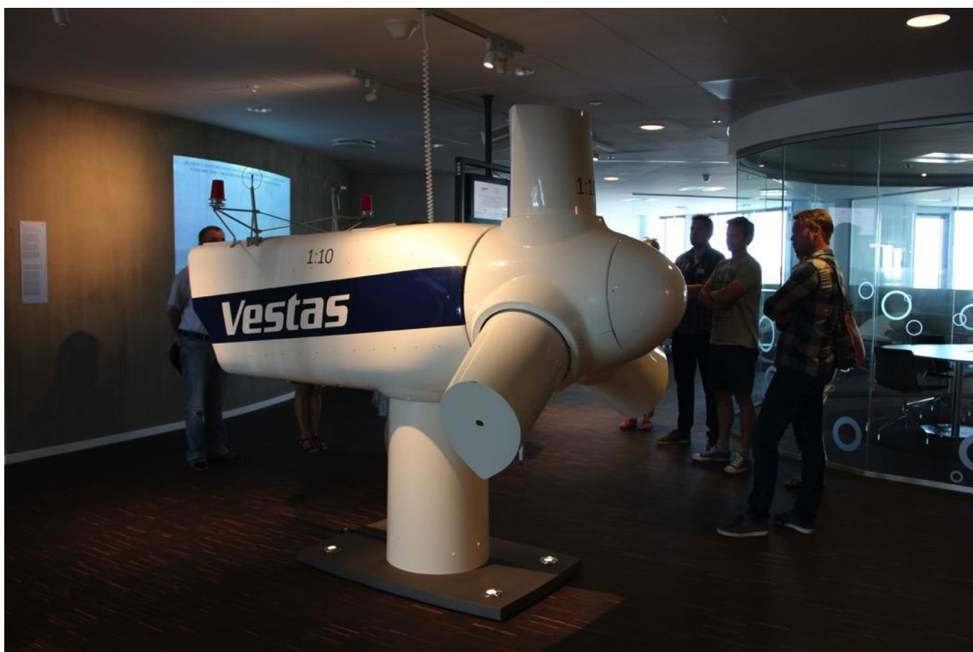
Installationen bestod bl.a. af en vindmølle i målestoksforholdet 1:10.