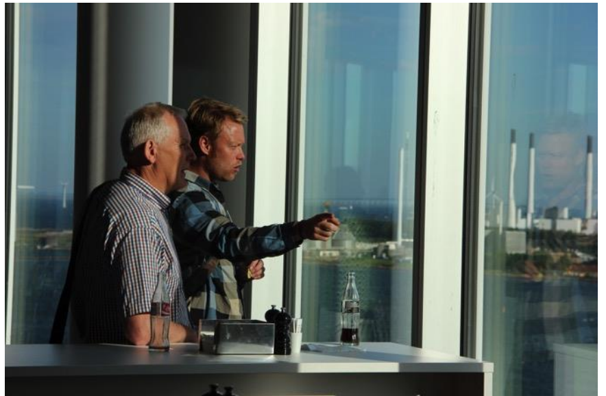
En spændende eftermiddag afslutter vi med en forfriskning og hyggelig networking i kantinen med den fantastiske panoramaudsigt.