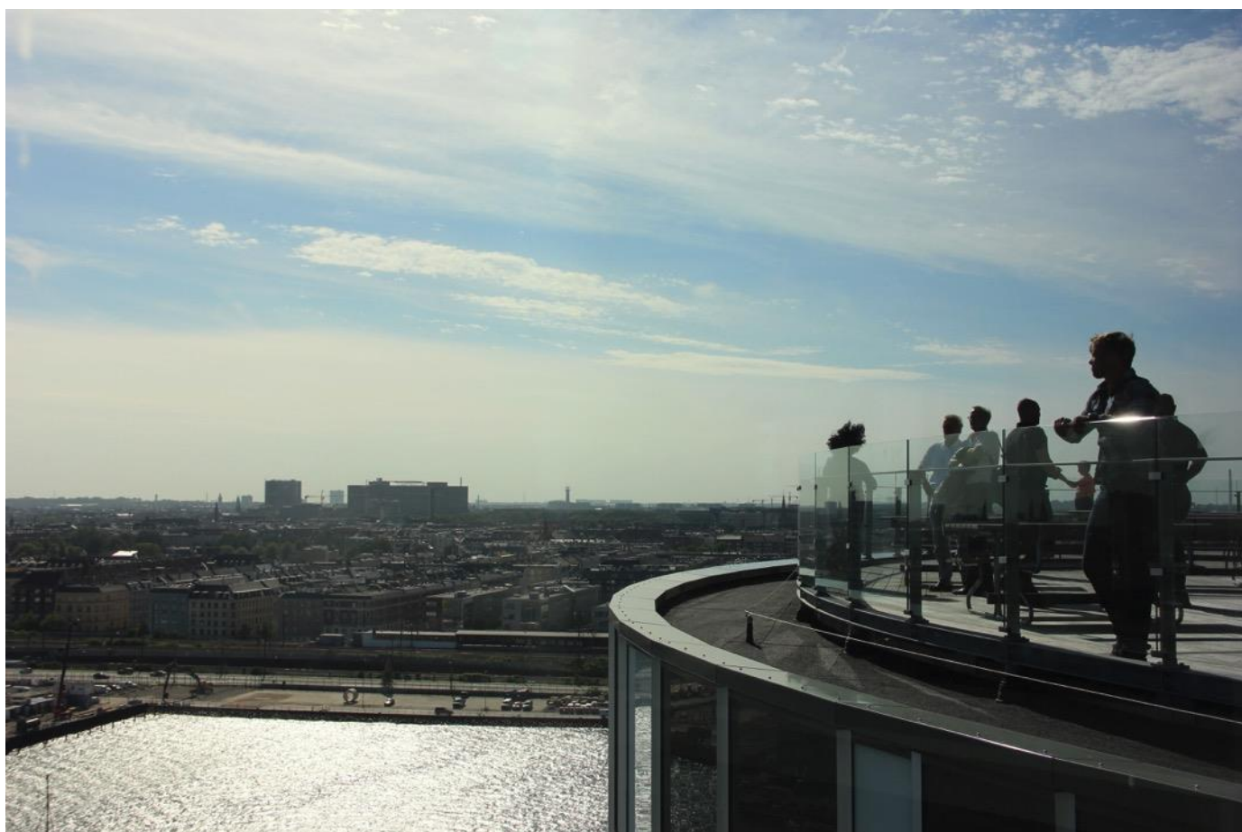
Panoramaudsigten fra 12. etage nydes i det dejlige vejr.